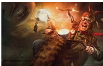
Matthias Schwaighofer – Bildbearbeitung